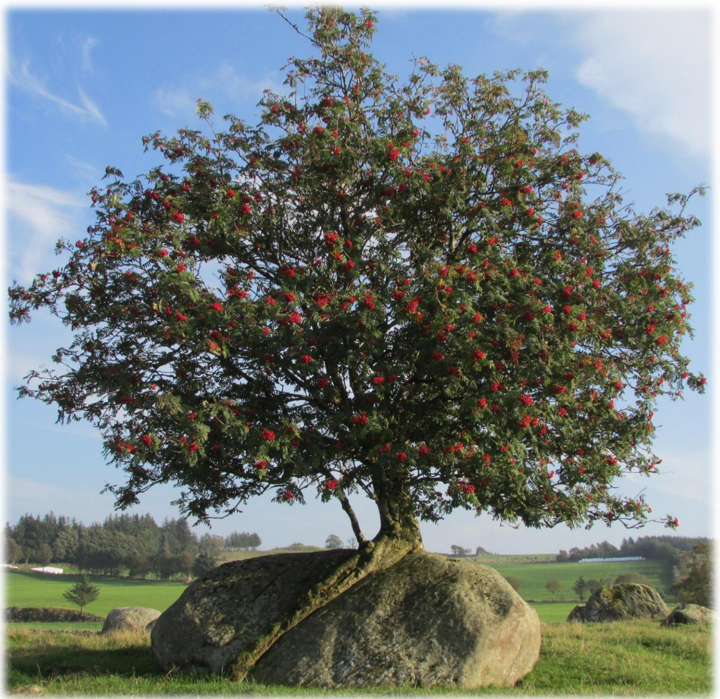
Raudn på Tunheim.